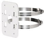
PFA152 Dispositif de montage sur mât