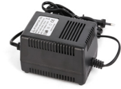
24 V CA/3 A Alimentation électrique