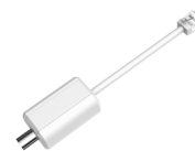
LR1002 Convertitore ePoE su coassiale