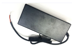
E080-1A360223B3 Блок питания