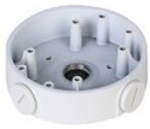
PFA139 Монтажная коробка