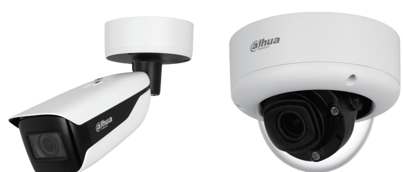
IPC Wizmind X Serie